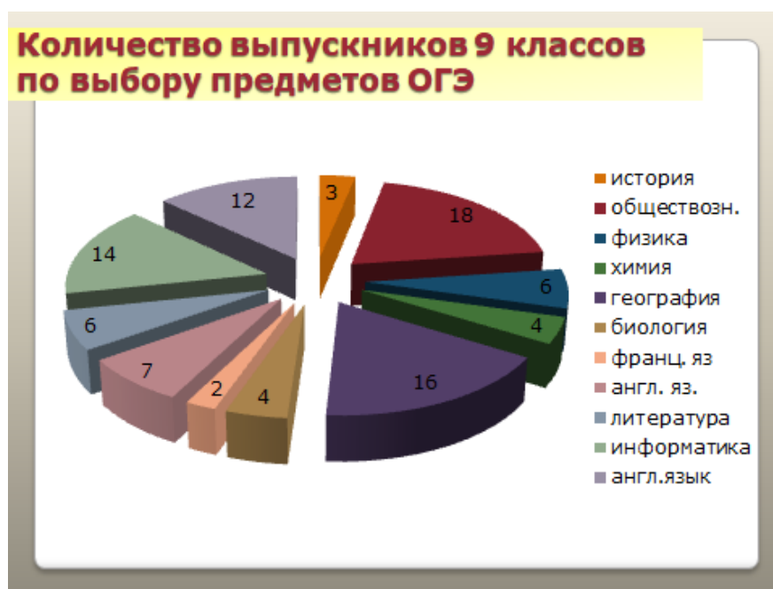
Диаграмма показывает, что наибольшее количество выпускников 9-х классов (18 человек), как, впрочем, уже традиционно сложилось, выбрали обществознание, На втором месте география (16 человек), затем информатика (14 человек) и английский язык (12 человек).

В 2018 году выпускники основного общего образования сдавали 4 экзамена: русский язык и математику как обязательные предметы и два предмета по выбору. Средний балл на итоговой аттестации составил 4,2 балла.